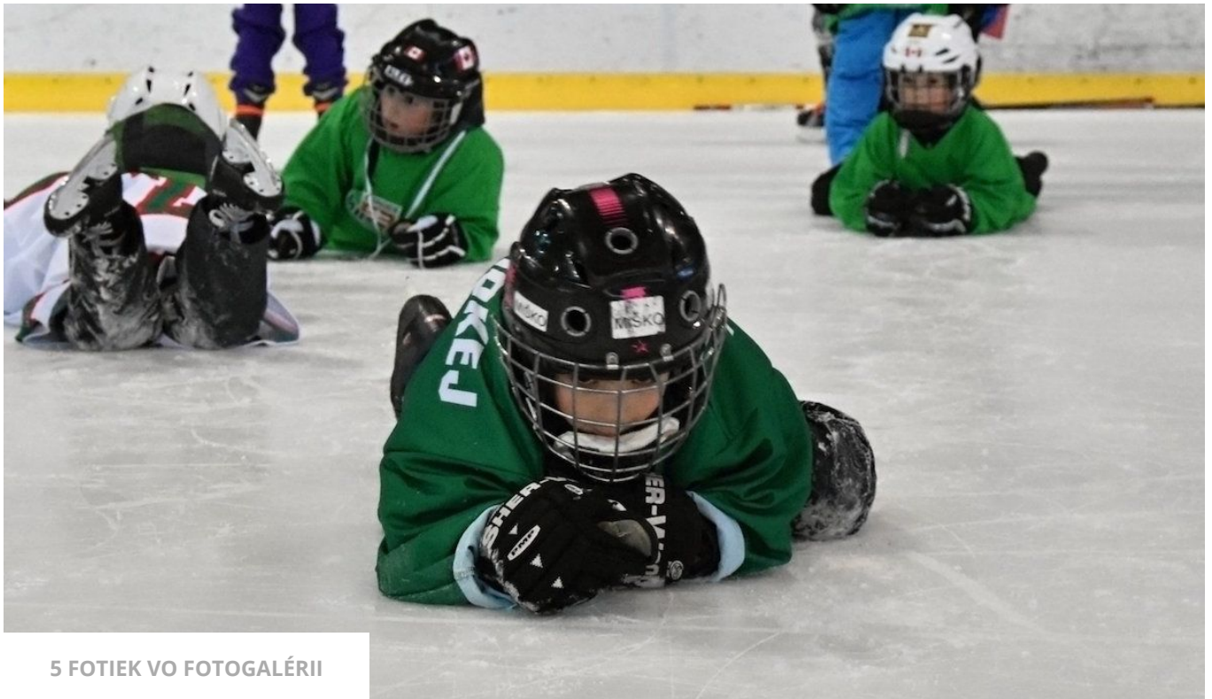
5 FOTIEK VO FOTOGALÉRII

Dôraz rodiča by nemal byť kladený na to, aby vo svojom 10-ročnom synovi videl budúcu hviezdu NHL. Mimochodom, na slovo talent začínam byť alergický. Viete, aká je konkurencia vo svete obrovská? Koľko šťastia, potu, odriekania, tvrdohlavosti a zhôd okolností potrebujete, aby ste sa na svetovej úrovni presadili? To, že sa niekomu zdá, že ich piatačik sa na ľade pohybuje lepšie ako jeho rovesníci, ešte neznamená, že by v ňom mali jeho rodičia vidieť viac, ako je, čiže dieťa, ktoré sa chce zabávať a uvoľnene robiť to, čo ho baví.